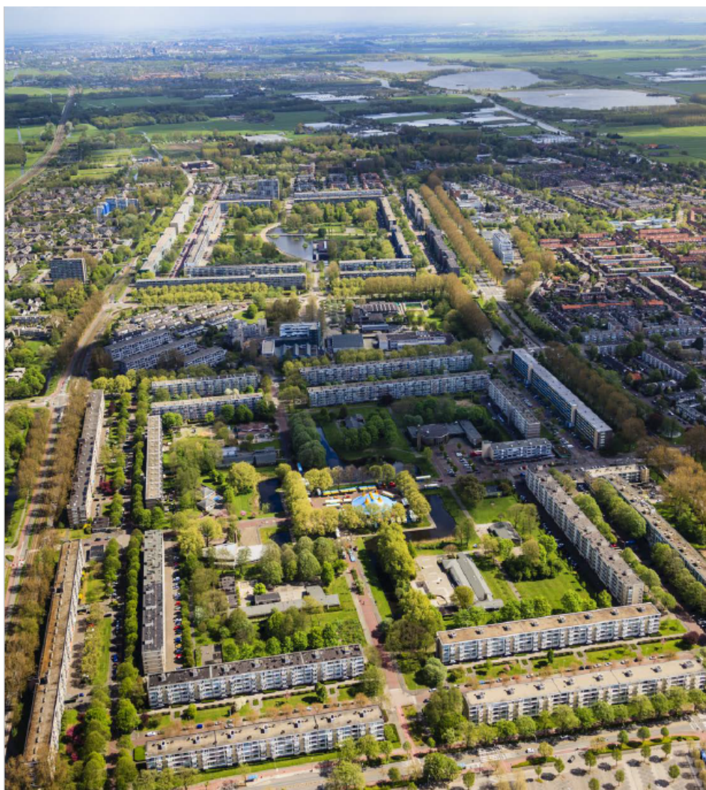
Objectnummer (12364-37970)